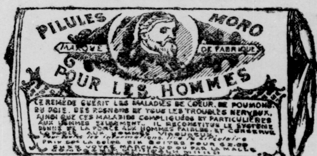
Le papier de l'enveloppe est blanc, imprimé en bleu.

COMPAGNIE MEDICALE MORO, 1724 rue Ste-Catherine, Montréal.