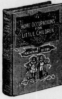
Home, 144 pages; bound in linen, gilt top.