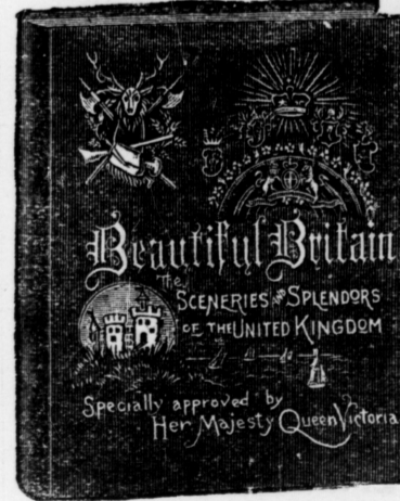
Large quarto volume (13 1/2 x 13 1/2 ins.), 255 pages. Extra enameled paper. Extra English cloth, emblematic embossing in gold.

A magnificent collection of views, with elaborate descriptions and many interesting historical notes. Text set within emblematic borders, printed in a tint. A fine example of up-to-date printing.