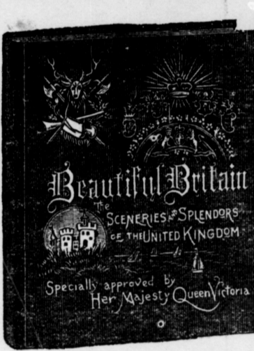
Large quarto volume (11 1/2 x 13 1/2 ins.), 386 pages. Extra enameled paper. Extra English cloth, emblematic embossing in ink and gold.

The Scenery and the Splendors of the United Kingdom.