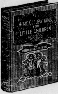
166 pages; bound in linen, gilt top.