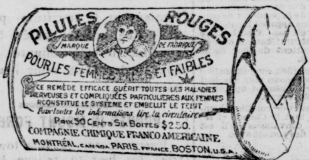
L'Etiquette est de papier blanc imprimé en rouge.

COMPAGNIE CHIMIQUE FRANCO-AMERICAINE, 274, rue St-Denis, Montréal.