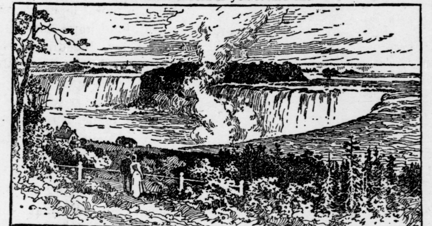
This cut illustrates but very faintly the magnificence of the original.

There are only a few copies of this magnificent art work left and you will be fortunate indeed if you secure one.