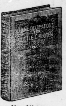
16mo, 144 pages; bound in linen, gilt top.

Hundreds of Hints on How to Make the Little Folks Happy Lists of Stories, Songs and Plays Invaluable to Mothers and Nurses