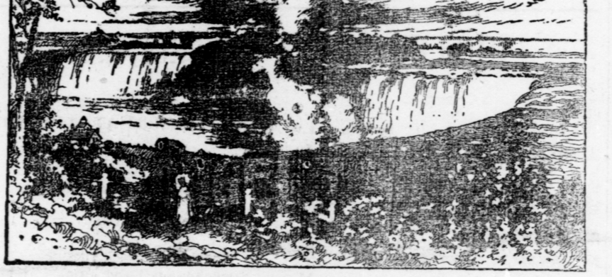
This cut illustrates but very faintly the magnificence of the original. The above reproduction is less than one-fiftieth the actual size, the engraved surface being 4 1/2 x 6 1/2 inches, printed on heavy paper for framing. Actual size of picture 46 1/2 x 27 inches. The publisher's price is $25.00, unframed, and that is what a copy would cost you in the art stores. It is a work that would grace the walls of the most palatial mansion in the land.

There are only a few copies of this magnificent art work left and you will be fortunate indeed if you secure one.