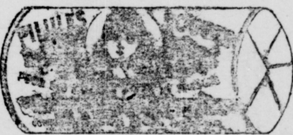
Le papier est blanc imprimé en encre rouge.

Nous invitons aussi nos patientes à venir voir les Médecins Spécialistes de la CIE CHIMIQUE FRANCO-AMERICAINE, si elles désirent avoir plus de renseignements sur leurs maladies ou sur le mode d'emploi des PILULES ROUGES, ou de leur écrire; les consultations, personnelles ou par lettres données par nos Médecins sont absolument gratuites et ne pourront manquer d'être utiles aux femmes qui souffrent et veulent se guérir. Nos PILULES ROUGES se vendent par la boîte ou 6 boîtes pour $2.50, envoyées par la maille au Canada et au Etats-Unis sur réception du montant.